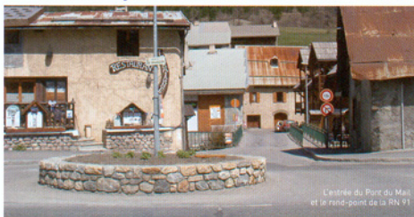
L'entrée du Pont du Mail et le rond-point de la RN 91

La commune de la Salle-les-Alpes a pour projet la réfection totale du pont du Mail. Dans ce cadre, la municipalité a confié au C.A.U.E une étude préalable paysagère autour de la reconstruction de ce pont. Une structure qui offre un accès au village de Villeneuve et se situe dans le périmètre de protection des Monuments Historiques. L'objectif principal de la municipalité est d'intégrer cet ouvrage dans le site. Une requalification du traitement de sol de la rue centrale est également souhaitée afin d'apporter une réponse paysagère d'ensemble cohérente.