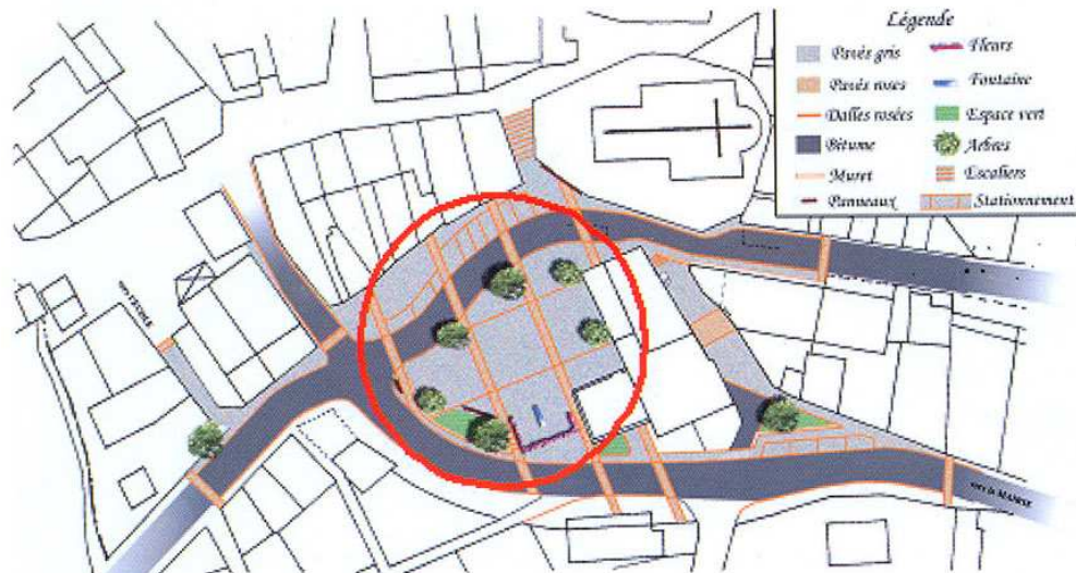
Trame de la place

Le diagnostic réalisé par le CAUE met en évidence certaines lacunes ou anomalies ainsi qu'un manque d'homogénéité au niveau notamment de la signalétique, du stationnement et du mobilier urbain. Si ce diagnostic vaut pour l'ensemble du village, son centre, sur lequel a porté notre étude de faisabilité, en souffre particulièrement. Il apparaît que cet espace, cœur de la vie du village, est dévalorisé en raison de son manque de lisibilité.